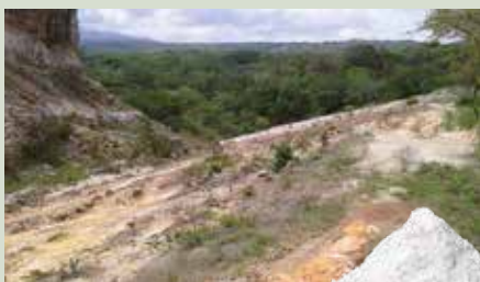
Διοξειδίο του πυριτίου Φυσικό κόκκασμα

Προκαλεί ισχυρή αφυδάτωση σε όλα τα έντομα που έρχονται σε επαφή με το προϊόν.